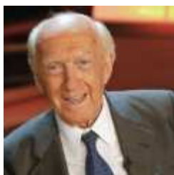
Raimondo Vianello nasce il 7