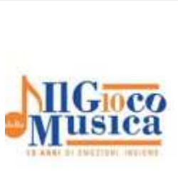
Accademia di Santa Cecilia e