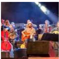
All'Auditorium Parco della